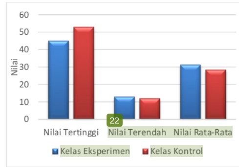
Gambar 1. Perbandingan Hasil Tes Awal Keterampilan Proses Sains Siswa

Penelitian ini bertujuan untuk mengetahui apakah ada pengaruh penggunaan model pembelajaran generatif dengan teknik guided teaching terhadap keterampilan proses sains siswa kelas X SMA Negeri 7 Mataram. Adapun keterampilan proses sains siswa sebelum diberikan perlakuan terlihat dari nilai tes awalnya ( pre-test ), dan penguasaan konsep setelah diberikan perlakuan terlihat dari nilai tes akhir ( post-test ). Tes keterampilan proses sains yang diberikan adalah tes tertulis berbentuk pilihan ganda beralasan. Tes awal dilakukan untuk mengetahui homogenitas serta normalitas sampel. Adapun hasil tes awal dapat dilihat pada Gambar 1.