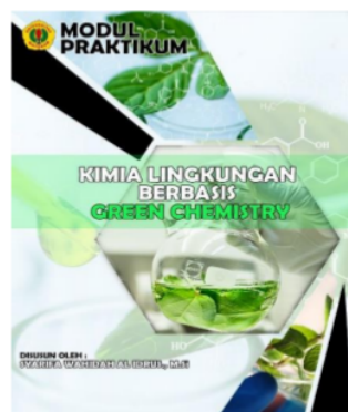
Gambar 1. Sampul Depan Modul

Pengembangan modul praktikum kimia lingkungan dilakukan berdasar hasil kerangka pada tahap pertama. Pada tahap pengembangan modul dibagi menjadi, bagian awal modul terdiri atas (1) sampul modul, (2) kata pengantar, (3) daftar isi, (4) tata tertib, (5) penilaian praktikum, (6) prosedur umum pelaksanaan praktikum, (7) sistematika penulisan laporan, (8) pengenalan alat laboratorium, (9) pendekatan Green Chemistry dan (10) deskripsi praktikum Kimia Lingkungan.