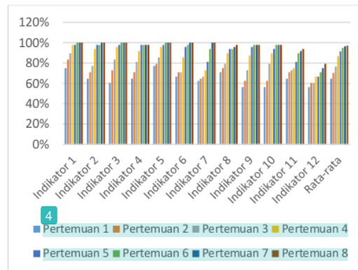
Gambar 1. Ketercapaian rata-rata kemampuan anak untuk tiap indikator dan tiap pertemuan

Stimulasi menggunakan permainan congklak dilakukan 8 kali pertemuan, dengan waktu 3 minggu. 3 kali di minggu pertama, 3 kali minggu kedua, dan 2 kali minggu ketiga. Indikator yang digunakan dalam penelitian ini terdiri dari 12 indikator, antara lain mengelompokkan biji congklak berdasarkan warna, bentuk, mengisi lubang sesuai jumlah, menghitung secara lisan, dan menunjukkan lambing bilangannya dan menuliskannya, mengurutkan jumlah biji-bijian, meronce biji congklak sesuai pola, dan mengatur strategi bermain.