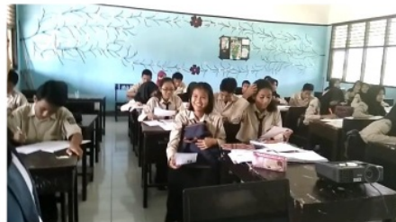
Gambar 6. Kondisi saat Mengerjakan Kuis

Langkah verifikasi dan pengecekan yaitu pemberian tes individu diiringi pemutaran