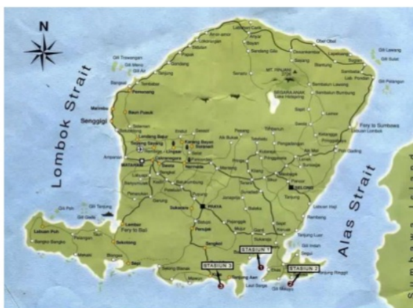
Gambar 1. Lokasi pengambilan sampel di tiga stasiun

Penelitian dilaksanakan pada bulan Agustus sampai bulan November 2017. Pengambilan sampel ikan baronang di perairan laut selatan pulau Lombok pada tiga stasiun (Gambar 1). Ikan baronang adalah ikan ekonomis penting yang memiliki potensi bibit paling tinggi di lokasi studi (Syukur et al. , 2016).