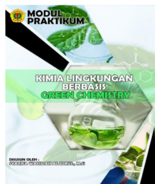
Gambar 1. Sampul Depan Modul

Pengembangan modul praktikum kimia lingkungan dilakukan berdasar hasil kerangka pada tahap pertama. Pada tahap pengembangan modul dibagi menjadi, bagian awal modul terdiri atas (1) sampul modul, (2) kata pengantar, (3) daftar isi, (4) tata tertib, (5) penilaian praktikum, (6) prosedur umum pelaksanaan praktikum, (7) sistematika penulisan laporan, (8) pengenalan alat laboratorium, (9) pendekatan Green Chemistry dan (10) deskripsi praktikum Kimia Lingkungan.