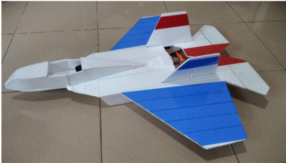
Gambar 2. Pesawat aeromodelling jenis delta wing yang telah diujicoba.

Pesawat aeromodelling jenis delta wing yang telah dibuat dan diujicoba pada penelitian ini ditunjukkan oleh gambar 2. Berat terbang (all unit weight) pesawat ini sebesar 426 gram force yang setara dengan 4,2 Newton menggunakan asumsi percepatan gravitasi sebesar 9,8 \text{ m/s}^2 . Pengukuran berat terbang dilakukan dengan menimbang berat pesawat secara keseluruhan yang terdiri dari polyfoam, motor brushless, electronic speed controller (ESC), transmitter, servo, pushrod dan baterai. Pengukuran gaya dorong pesawat dilakukan dengan menggunakan timbangan digital sebagaimana ditunjukkan pada gambar 2. Gaya dorong yang diukur terdiri dari 5 kali pengukuran dengan kapasitas throttle yang berbeda-beda yaitu 20%, 40%, 60% 80%, dan 100%. Walaupun remote flysky I-6 memungkinkan untuk menghasilkan throttle sebesar 120%, tetapi hal ini tidak dilakukan untuk menghindari penurunan tegangan akibat over discharge yang akan mengakibatkan cut off sehingga mesin mati seketika.