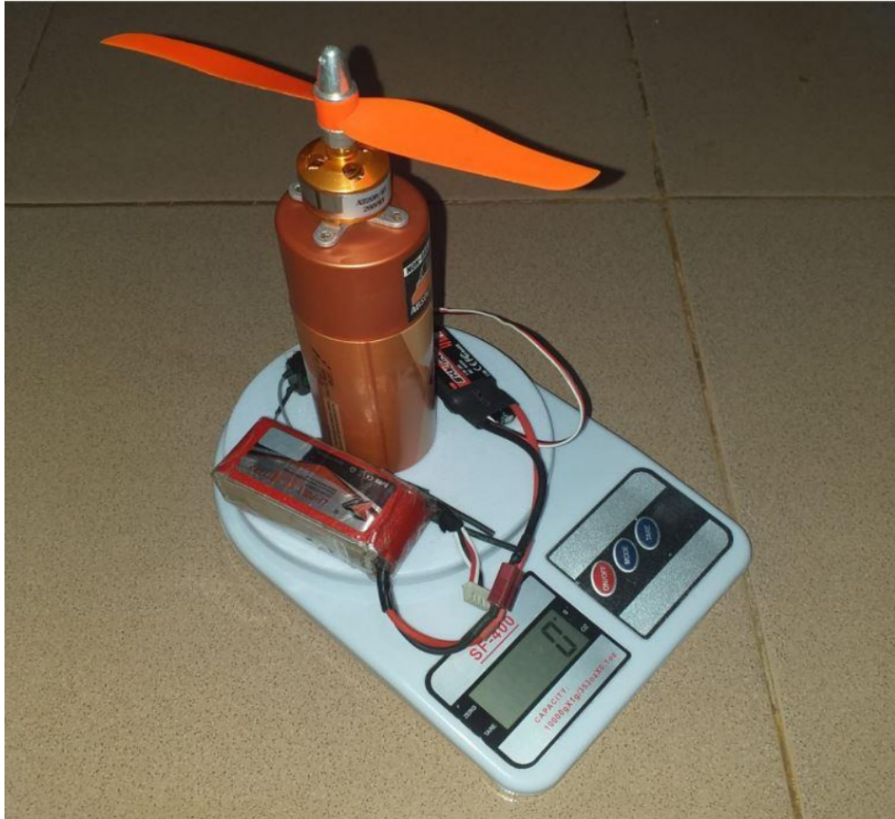
Gambar 3. Pengukuran gaya dorong motor brushless dengan timbangan digital SF-400.

Pengukuran gaya dorong motor listrik dilakukan dengan timbangan digital seri SF-400 dengan kapasitas maksimum 10 kg sebagaimana ditunjukkan oleh gambar 3. Dalam melakukan penimbangan perlu diperhatikan bahwa semua unit harus menempel pada timbangan dengan baik sehingga baterai, receiver, dudukan motor harus dilem sementara pada dudukan timbangan agar ketika terjadi dorongan posisinya tidak berubah sehingga tidak mempengaruhi gaya dorong yang terukur. Kabel juga tidak boleh menyentuh bagian luar timbangan agar tidak mengurangi gaya dorong terukur. Motor brushless sengaja diletakkan pada ketinggian yang cukup agar dapat mengambil udara dengan ruang yang cukup sehingga mirip dengan kondisi terbang, sehingga gaya dorong terukur lebih akurat. Keunggulan timbangan digital seri SF-400 adalah ketika dinyalakan dalam keadaan terdapat beban, maka semua beban terkoreksi, sehingga angka menunjukkan pembacaan nol, sehingga dorongan yang terukur saat dilakukan pembebanan adalah beban tambahan setelah instrumen timbangan dinyalakan.