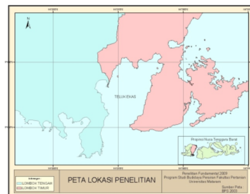
Gambar 1. Lokasi Penelitian Aspek Reproduksi Lobster

Penelitian aspek reproduksi lobster dilakukan di perairan Teluk Ekas Pulau Lombok, Nusa Tenggara Barat (Gambar 1) yang dimulai dari bulan Juni 2009 sampai dengan Nopember 2009. Pengumpulan contoh lobster dilakukan dengan menggunakan alat tangkap berupa jerat, dan hasil tangkapan nelayan penyelam di perairan Teluk Ekas