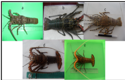
Gambar 2. Species Lobster di Perairan Teluk Ekas

ornatus adalah 2,54:1, P. penicillatus adalah 0,52:1 dan P. longiceps adalah 1:1. Hasil analisis uji chi square terhadap kelima spesies lobster pada bulan Juni sampai Nopember 2009 tersebut tidak berbeda nyata. Hal ini menunjukkan bahwa nisbah kelamin antara individu jantan dan betina dalam keadaan seimbang (1:1). Effendi (1997) menyatakan dengan keseimbangan perbandingan antara individu jantan dan betina, maka kemungkinan terjadinya pembuahan sel telur oleh spermatozoa semakin besar. Variasi nisbah kelamin terjadi karena tiga faktor yaitu perbedaan tingkah laku seks, kondisi lingkungan dan lokasi penangkapan.