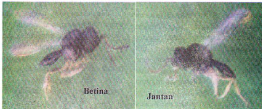
Gambar 2. Parasitoid Telenomus cyrus yang menyerang telur lalatjala ( Chrysopa sp.) pada ekosistem jambu mete di Lombok