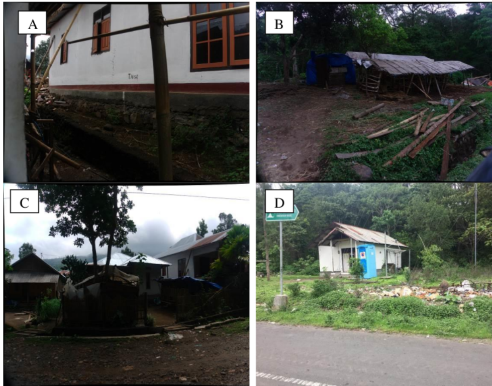
Gambar 1. (A) Bagian Rumah yang masuk kedalam kawasan TNGR, (B) Aktivitas pembuatan kandang di dalam kawasan TNGR, (C) Rumah masuk dalam kawasan TNGR, (D) sampah didalam kawasan, (Sumber Gambar : Canopi Rimbawan Indonesia 2018)

bawang, serta membangun rumah.(lihat gambar 1).