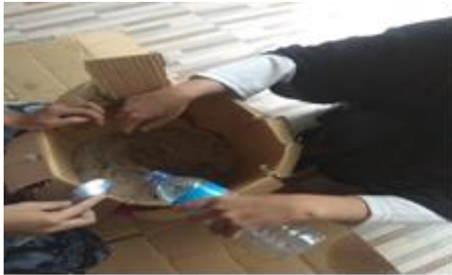
Gambar 2. Proses pembuatan pupuk organik

sayuran menjadi nutrisi atau pupuk organik. Selanjutnya larutan A dan B ditambahkan kedalam pupuk organik padat. Pada pupuk organik padat sebelumnya telah diisi oleh sekam dan dedak serta sisa-sisa sayuran. Partisipasi dan antusiasme masyarakat sangat tinggi dalam mengikuti penyuluhan mengenai pembuatan pupuk kompos tersebut. Hal ini dapat dilihat dari banyaknya peserta yang bertanya terkait pembuatan pupuk kompos.