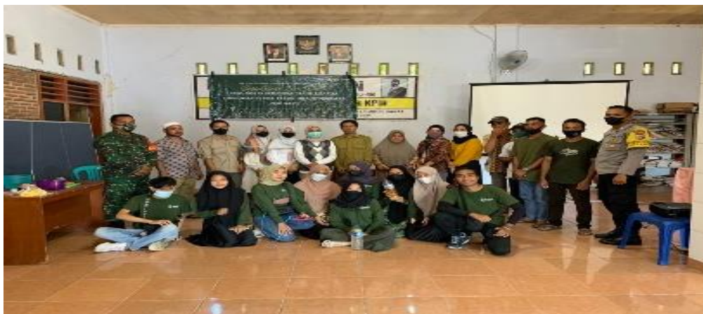
Gambar 1. Acara sosialisasi pembuatan pupuk organik

Pengelolaan sampah menjadi kompos bertujuan untuk mengurangi tingginya volume sampah yang ada di Desa Ranjok, Kecamatan Gunung Sari, Kabupaten Lombok Barat menjadi produk baru yang dapat dimanfaatkan sebagai pupuk. Pelaksanaan kegiatan melalui beberapa tahapan yaitu tahap persiapan, tahap pelaksanaan serta tahap pelaporan. Tahap persiapan meliputi penyiapan materi presentasi, pemilihan lokasi kegiatan, undangan peserta dan menyiapkan lokasi kegiatan. Pada tahap pelaksanaan, dilakukan kegiatan sesuai perencanaan awal meliputi tahap sosialisasi dengan presentasi materi pentingnya pengelolaan sampah rumah tangga menjadi pupuk organik. Tahap ini dilanjutkan dengan pengolahan sampah rumah tangga menjadi pupuk organik/kompos dan melakukan packing hasil pupuk kompos.