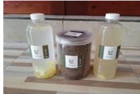
Gambar 3. Produk pupuk organik