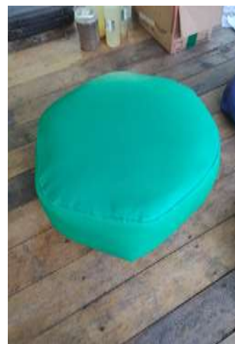
Gambar 3. Tempat duduk sebagai produk ecobrick

terjadi peningkatan terhadap pengetahuan tentang kategori sampah dari sebelum dilakukan edukasi karena telah dilakukan sosialisasi dan pelatihan pemilahan sampah serta pembuatan pupuk organik cair dari sampah rumah tangga. Pengetahuan tentang ecobrick juga mengalami peningkatan dengan adanya masyarakat yang mengumpulkan material sampah anorganik untuk didesain menjadi ecobrick.