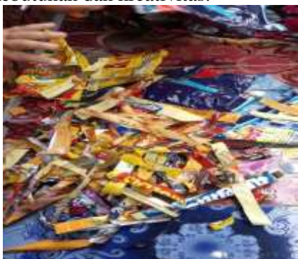
Gambar 1. Pengguntingan kemasan plastik plastik dan memasukkan kedalam botol

menjadi barang/benda lain seperti meja dan lainnya berdasarkan kebutuhan dan kreativitas.