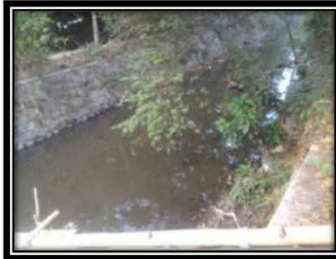
Gambar 2. Stasiun I