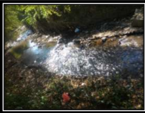
Gambar 3. stasiun II