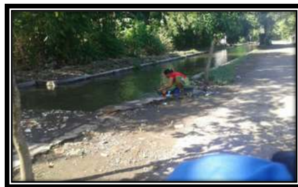
Gambar 4. Stasiun III