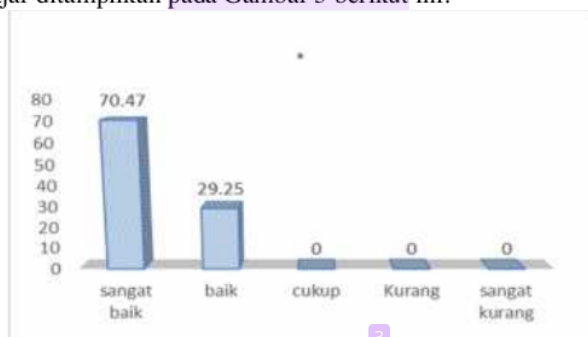
Gambar 3: Persentase Capaian Hasil Belajar Siswa

Hasil belajar siswa kelas XI MIPA SMA Negeri di Kota Mataram pada masing-masing kategori hasil belajar ditampilkan pada Gambar 3 berikut ini.