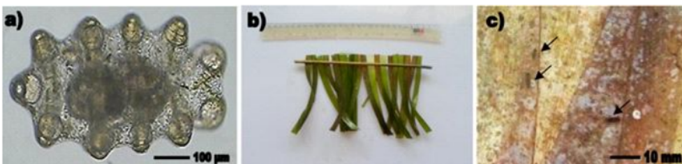
Gambar 1. Penempelan larva pada substrat lamun; (a) larva fase doliolaria umur 16 hari dengan ukuran 620-630 µm; (b) lamun E. acoroides sebagai substrat penempelan; (c) Juvenil teripang pasir yang menempel pada substrat lamun

Keberhasilan larva untuk berkembang menjadi juvenil sangat dipengaruhi oleh proses transisi dari fase planktonik menjadi benthik. Pada fase ini larva memerlukan substrat untuk menempel dan mengalami metamorfosis dari pentactula ke juvenil (Battaglione & Seymour, 1998). Berdasarkan hasil yang diperoleh dalam penelitian ini, tidak semua larva yang dipelihara berhasil menempel dan mengalami proses metamorfosis. Jenis dan kondisi substrat diduga menjadi variabel penting yang memengaruhi proses