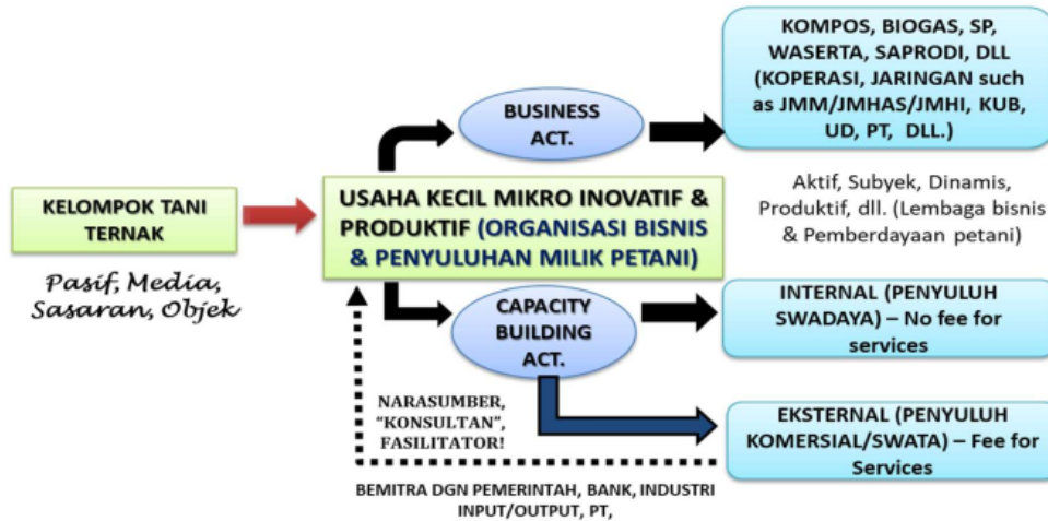
Gambar 1. Model Ideal Pengembangan Kelompok Tani Ternak

atau pengurus mendapatkan imbalan atas layanan yang diberikannya). Gambar 1 di bawah ini memberikan ilustrasi model atau rekayasa sosial yang dihasilkan dari kegiatan penelitian ini – Kelembagaan Petani sebagai Penggerak Ekonomi Desa, dan sebagai Kelembagaan Pelaksana Penyuluhan Swadaya dan Penyuluhan Swasta.