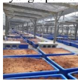
Gambar 6. Pemandahan wadah berisi batang nanas ke dalam greenhouse

Pemandahan dilakukan setelah penanaman batang nanas di dalam wadah. Hal ini dilakukan untuk memudahkan perawatan dan memberikan kondisi yang optimal bagi pertumbuhan bibit.