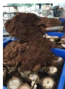
Gambar 5. Penanaman batang nanas

Penanaman batang nanas dilakukan di dalam wadah yang sudah disiapkan dengan media tanam cocopeat. Batang nanas yang sudah dipotong diletakkan dan disusun di atas media tanam cocopeat berurutan sebanyak 24 buah yang selanjutnya ditutup dengan cocopeat sampai batang nanas tidak terlihat.