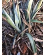
Gambar 2. Tanaman nanas yang sudah dicabut

Tanaman nanas yang sudah dipanen selanjutnya dilakukan pencabutan untuk diambil bagian batangnya.