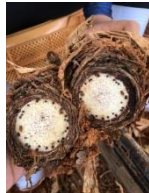
Gambar 3. Batang nanas yang sudah dipotong

Hal pertama yang dilakukan adalah membuang daun nanas yang ada pada tanaman nanas, selanjutnya memotong ujung batang nanas dengan ukuran 0,5 cm sampai 1,0 cm. Kemudian memotong batang nanas dengan ukuran 3 cm sampai 4 cm (Dewan Promosi Tindakan Struktural Ekonomi Perfektur Okinawa, 2016).