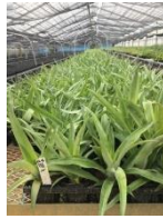
Gambar 7. Bibit nanas yang sudah dipindahkan ke dalam polybag

Pembesaran bibit dilakukan dengan melakukan pemindahan bibit yang sudah tumbuh di dalam wadah pembibitan ke dalam polybag. Bibit yang dipindahkan ke dalam polybag di klasifikasikan menjadi tiga ukuran kelas yaitu ukuran kelas besar ( dai ), sedang ( chu ), dan kecil ( sho ).