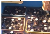
Gambar 4. Proses dipping pada batang nanas yang sudah dipotong

Dipping merupakan proses perendaman dengan campuran fungisida (arietti dengan dosis 500 g dalam 100 l air) dan insektisida (supurasaido dengan dosis 100 ml dalam 100 l air). Perendaman dilakukan selama 15 menit, setelah itu batang nanas ditiriskan sebelum dilakukan penanaman.