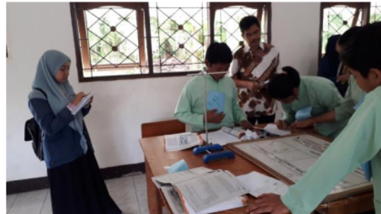
Gambar 3. Observer mencatat aktivitas siswa

Pada kegiatan open class (tahap do), guru model melaksanakan pembelajaran di kelas sesuai dengan lesson design yang telah dibuat pada tahap plan. Guru-guru IPA lainnya bertindak sebagai observer, termasuk Kepala Sekolah dan Pengawas Mata Pelajaran IPA Kota Mataram. Observer mengamati proses pembelajaran. Menurut Kemendikbud (2019), landasan perlunya observasi di kelas adalah: Untuk menjamin siswa belajar sesuai dengan harapan/ ditargetkan; Untuk memperoleh gambaran bagaimana reaksi siswa terhadap aktivitas guru; Untuk melihat siswa mana yang mengalami kesulitan sehingga kita dapat memberikan bantuan belajar yang sesuai; Untuk memastikan high achievers dapat membantu temannya yang low achievers. Kegiatan observasi aktivitas siswa oleh observer dapat dilihat pada Gambar 3.