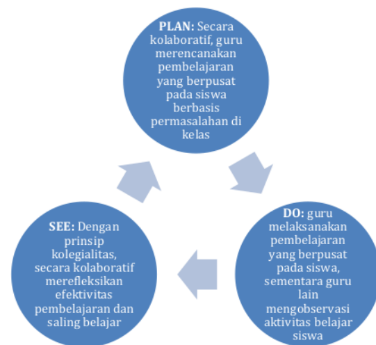
Gambar 1. Siklus Pengkajian Pembelajaran dalam LSLC

Kegiatan pendampingan ini dilakukan melalui 4 tahapan yaitu tahap sosialisasi LSLC, tahap plan, tahap do, dan tahap see. Menurut Samani (2009), setiap siklus LSLC dilaksanakan dalam 3 (tiga) tahap, yaitu tahap pertama adalah Plan (merencanakan), tahap kedua adalah Do (melaksanakan), dan tahap ketiga adalah See (merefleksi). Tiga tahap tersebut (satu siklus) dilaksanakan secara berkelanjutan. Dengan kata lain LSLC merupakan suatu cara peningkatan mutu pendidikan yang tak pernah berakhir (continuous improvement). Siklus LS dapat dilihat pada Gambar 1.