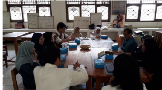
Gambar 4. Tahap see (refleksi dan re-design)

Di akhir tahap see, dilakukan re-design tentang chapter design dan lesson design sesuai dengan masukan dari observer dan narasumber. Menurut Kemendikbud (2019), refleksi akan bermakna jika dimusyawarahkan. Refleksi adalah kesadaran sebagai jawaban suatu hal/ kegiatan yang datang dari luar. Tahapan refleksi: Duduk melingkar/ letter U; Ada moderator (leader: kepala sekolah, dinas pendidikan, pengawas, komite sekolah); Guru model dan observer menyampaikan kesan, pelajaran yang didapat & temuannya; Observer tidak mengkritik cara guru mengajar tetapi memberi masukan; Penyampaian bahasan dari pembahas (guru senior/nara sumber/ dosen). Tugas Pembahas (narasumber/tim pengabdian): Memberikan pembahasan tentang hal-hal yang unik/baru yang diperoleh selama refleksi; Memberikan penegasan tentang prinsip pelaksanaan LSLC sesuai hasil observasi dan refleksi; Mengarahkan peserta open class untuk mendapatkan lesson learn (bagi peserta pemula); Memberikan motivasi kepada moderator, guru model, dan peserta open class. Pelaksanaan tahap see dapat dilihat pada Gambar 4.