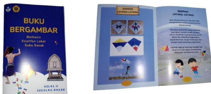
Gambar 2. Pencetakan buku

Berikut adalah gambar hasil pencetakan media pembelajaran buku bergambar berbasis kerifan lokal suku sasak: