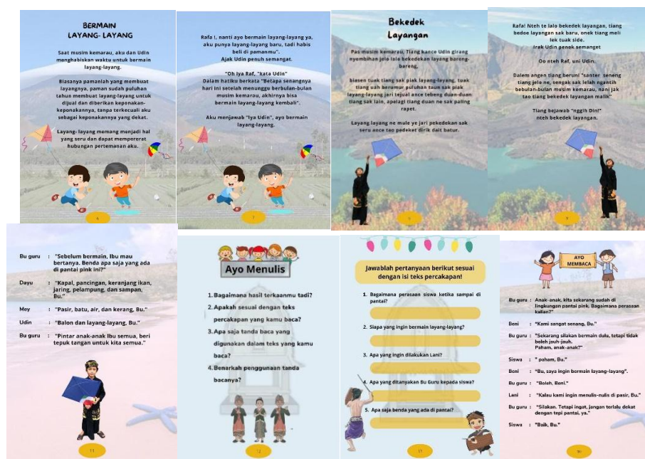
Gambar 1. Rancangan isi Media