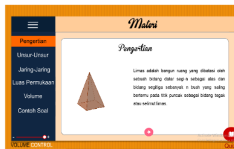
Gambar 2. Tampilan Halaman Materi