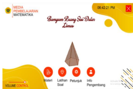
Gambar 1. Tampilan Halaman Utama

Pembuatan media pembelajaran ini dengan menggunakan bahan-bahan yang sudah di kumpulkan pada tahap pengumpulan bahan dan sesuai dengan flowchart serta storyboard yang sudah dirancang pada tahap desain. Pembuatan media pembelajaran ini dimulai dengan membuat desain-desain halaman di Adobe flash serta ilustrasi pendukung di Corel Draw dan Geogebra . Setelah semua desain selesai, berikutnya menginput acion script agar media pembelajaran dapat berjalan sesuai dengan yang diharapkan. Adapun hasil pembuatan media pembelajaran audio visual materi bangun ruang sisi datar adalah sebagai berikut: