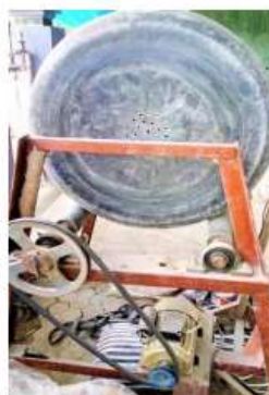
Gambar 1. Mesin pelapisan benih yang digunakan dalam riset ini, terdiri atas kerangka baja dilengkapi motor penggerak (2 PK, 750 watt) dan drum PVC (300 L) yang diputar dengan motor penggerak tersebut pada kecepatan 30–40 rpm.