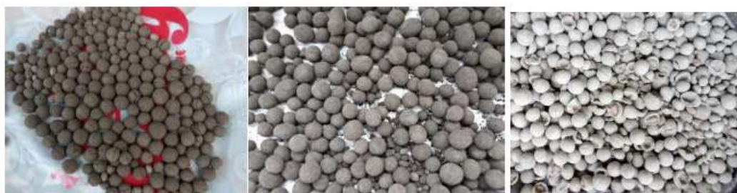
Gambar 2. Contoh hasil seed coating yang kurang baik (gagal). Dari kiri ke kanan: (a) coated seed jagung banyak pecak setelah dikeringkan, permukaan kasar, dan (b) banyak butiran kecil yang merupakan butiran urea terbalut bubuk batuan, diduga karena urea diaplikasikan sendiri/terpisah (tidak dilarutkan ke Orrin), dan (c) coated seed kacang tanah yang banyak pecah, kemungkinan karena pengaturan interval pembasahan awal dalam proses pelapisan benih (dengan air) yang tidak tepat, terlalu cepat.

Setelah dicoba beberapa skenario pelapisan benih dengan mempertimbangkan hal-hal seperti dijelaskan di atas, maka diperoleh benih berlapis pupuk organo mineral seperti ditunjukkan pada Gambar 2 dan 3. Tahapan pelapisan benih yang baik hasilnya: bubuk batuan basaltik dicampur dengan batuan fosfat dan bahan organik