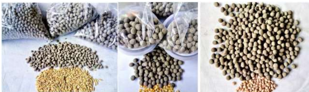
Gambar 3. Contoh hasil seed coating yang baik, tetapi belum tentu lolos uji percobaan. (a) benih padi, relatif mudah diproses, tidak ada masalah, dibagi menjadi 3 kelompok (kecil, sedang, dan besar) berdasarkan ukuran coated seed , (b) benih jagung, dan (c) benih kacang tanah.

halus. Setengah bagian dari campuran itu diaplikasikan pada benih menggunakan bahan perekat air; sedangkan setengahnya lagi diaplikasikan pada benih dengan bahan perekat larutan urea + Orrin.