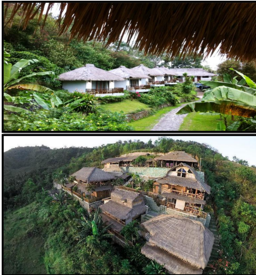
Gambar 2. Contoh Bentuk Ecolodge .

Pergeseran tren pariwisata mendorong terjadinya pergeseran pada pemilihan fasilitas akomodasi. Akomodasi khusus kini bukan hanya mengedepankan aspek keuntungan ekonomi dan kepuasan wisatawan, namun sesuai dengan konsep pengembangan pariwisata berkelanjutan yang mempertimbangkan aspek kelestarian lingkungan fisik maupun sosial budaya, salah satu bentuknya adalah Ecolodge (Effendi et al. , 2018).