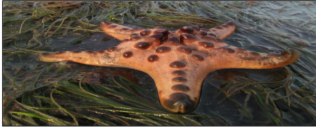
Gambar 2. Bintang Laut