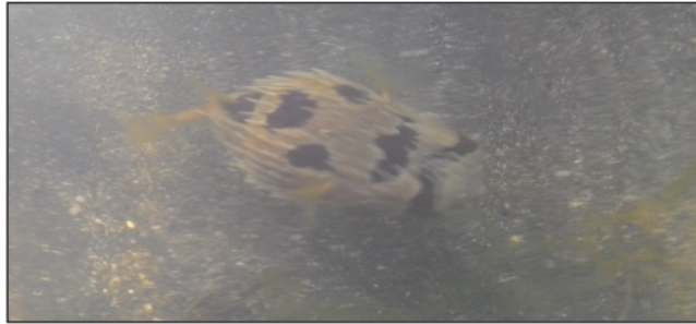
Gambar 3. Ikan buntal