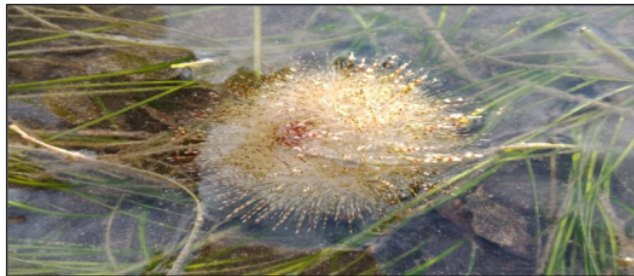
Gambar 4. Bulu babi