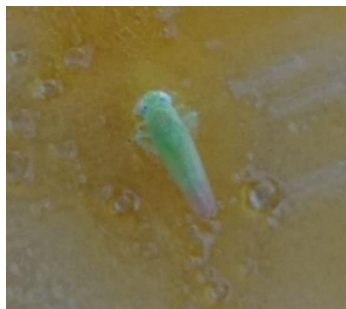
Gambar 4. Empoasca fabae