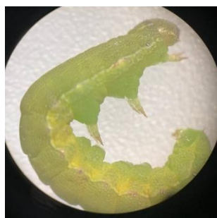
Gambar 3. Spodoptera exigua