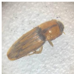
Gambar 6. Conoderus posticus