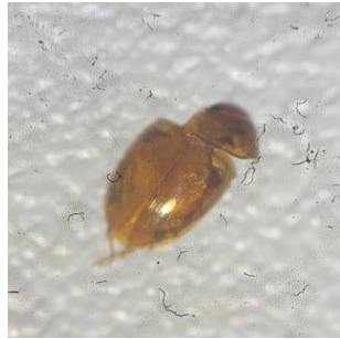
Gambar 5. Micraspis crocea