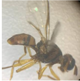
Gambar 2. Liriomyza chinensis