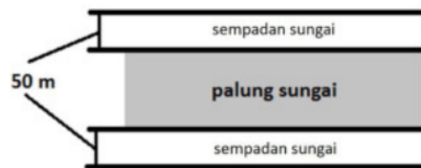
Gambar (Figure) 1. Sketsa jalur survei identifikasi bambu di sempadan Sungai Kedome ( Sketch of survey paths to identify bamboo in the Kedome riparian zone )

Republik Indonesia Nomor 38 Tahun 2011 mengenai sungai (Huzaemah et al. , 2016). Data dianalisis dengan menggunakan analisis deskriptif. Data yang telah diperoleh selanjutnya dievaluasi dan diadakan pengecekan silang dengan berbagai sumber, selanjutnya diringkas dan dibuat narasi (Newing, Eagle, Puri, & Watson, 2011). Gambar 1 menunjukkan sketsa survei di lapangan.