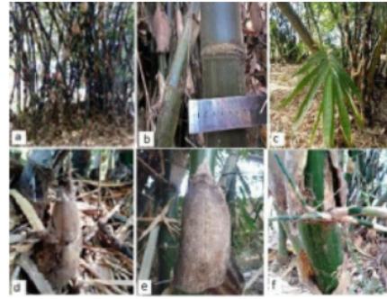
Gambar (Figure) 5. B. maculata ,

Deskripsi: Perawakan perdu, tinggi 20-23 m, diameter 4,50-6,17 cm, 86-150 individu per rumpun. Akar rimpang polimorf, akar udara muncul sampai ruas ke 2. Batang tegak, menyutera putih keabu-abuan, tersebar jarang. Percabangan hampir sama besar 3-5