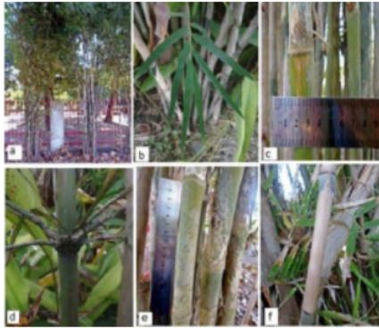
Gambar (Figure) 2. T. siamensis .

Keterangan (Remarks): (a). rumpun ( clumps ), (b). daun ( leaves ), (c). lebar batang ( stemp widht ), (d). percabangan ( branching ), (e). ruas batang ( stemp sections ), (f). pelepah batang ( stemp midrib )