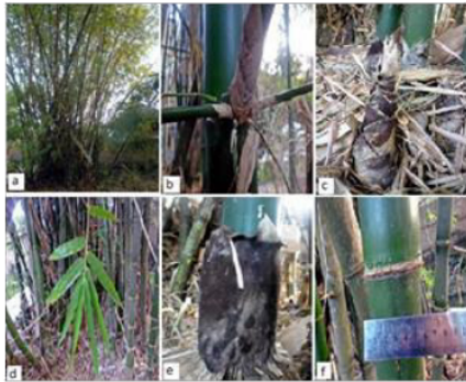
Gambar (Figure) 6. B. vulgaris

Keterangan: (a). rumpun ( clumps ), (b). percabangan ( branching ), (c). rebung ( bamboo shoots ), (d). daun ( leaves ), (e). pelepah batang ( stemp midrib ), (f). buku batang ( stems sections )