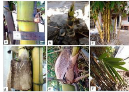
Gambar (Figure) 7. B. vulgaris var. vittata

Deskripsi: Perawakan perdu, tinggi 11-12 m, diameter 3,30-4,22 cm, 20 individu per rumpun. Akar rimpang memiliki akar udara yang tumbuh sampai buku 2-3. Ruas batang berwarna