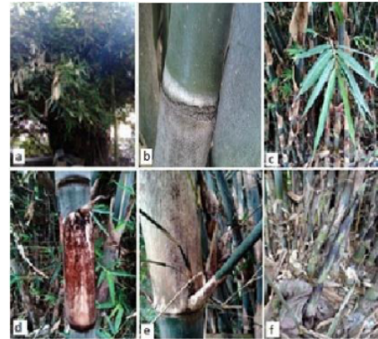
Gambar (Figure) 3. G. apus .

Deskripsi: Perawakan perdu, tinggi 8-15 m, diameter 3,15-4,10 cm, 10-63 individu per rumpun. Akar rimpang polimorf dan memiliki akar udara. Batang lurus, menyutera tersebar merata, tipis, hitam. Percabangan 1 cabang bagian tengah lebih besar dari 4-5 cabang lain, mulai muncul pada ruas