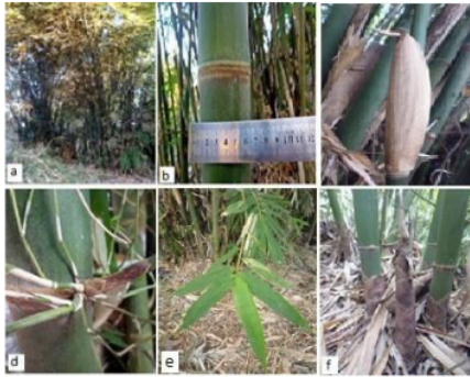
Gambar (Figure) 4. G. atter .

Keterangan: (a). rumpun ( clumps ), (b). buku batang ( stems sections ), (c). pelepah batang ( stemp midrib ), (d). percabangan ( branching ), (e). daun ( leaves ), (f). rebung ( bamboo shoots )