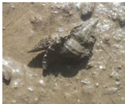
Gambar 2. C. capunicus sedang memakan Cerithidea sp. di ekosistem mangrove Gerupuk

(Assimineidae) dan Chicorius capunicus (Muricidae). Keduanya termasuk kelompok moluska asli mangrove yang persebarannya meliputi kawasan belakang hutan mangrove (Abbott dan Dance, 1991; Budiman, 2009; Goltenboth et al. , 2012). Selain itu, kelimpahan C. capunicus yang merupakan moluska karnivora yang bersifat oportunistis cenderung disebabkan karena kelimpahan jenis moluska lain termasuk Cerithidea spp. sebagai sumber makanannya di lokasi penelitian (Phintrakoon et al. , dalam Mujiono, 2016). Baharuddin et al. (2018) juga melaporkan bahwa gastropoda predator seperti Muricidae dapat ditemukan di seluruh zona dengan kelimpahan moluska tinggi.