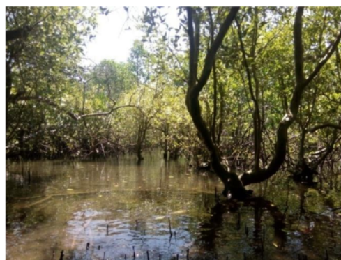
Gambar 4. Ekosistem mangrove alami Pemongkong, Lombok Timur

Keanekaragaman jenis ( H' ) moluska asosiasi mangrove berbanding lurus dengan keanekaragaman jenis tumbuhan mangrove yang ditemukan. Tumbuhan mangrove berperan sebagai sumber makanan bagi berbagai jenis moluska asosiasi di sekitarnya, atau berperan pula sebagai tempat bernaung, menempelkan diri, ataupun tempat mencari makanan (Supriharyono, 2009; Harahab, 2010; Kordi, 2014). Jenis-jenis tumbuhan mangrove yang ditemukan di ekosistem mangrove alami Pemongkong antara lain Avicennia alba , A. marina , C. decandra , Rhizophora mucronata , Scyphiphora hydrophyllacea , Sonneratia alba , dan S. caseolaris . Moluska asosiasi terutama dari famili Littorinidae dan Neritidae ditemukan paling banyak menempel pada akar, batang, atau daun Avicennia spp. Selain jenis A. alba , A. marina , dan S. hydrophyllacea , semua jenis mangrove tersebut ditemukan pula di ekosistem mangrove alami Gerupuk.