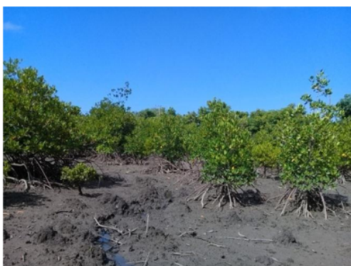
Gambar 3. Ekosistem mangrove rehabilitasi Teluk Gerupuk, Lombok Tengah

2019). Usia vegetasi mangrove Pemongkong diperkirakan sudah cukup tua dilihat dari diameter pohon S. alba yang ditemukan mencapai 50 cm. Menurut Nazim et al (2013) tumbuhan mangrove dengan ukuran dbh sekitar 18 – 32 cm memiliki usia sekitar 18-32 tahun dengan kecepatan tumbuh 1.15 \pm 0.17 cm/tahun (Aryanto et al , 2018). Vegetasi mangrove Gerupuk sendiri merupakan hasil rehabilitasi dan sebagian besar masih pada tipe pertumbuhan pancang atau pohon kecil. Usia vegetasi ini juga berkaitan dengan stabilitas ekosistem. Komunitas mangrove Pemongkong merupakan komunitas klimaks yang sangat stabil jika tidak ada gangguan yang cukup besar. Jika dibandingkan, komunitas mangrove Gerupuk masih berada dalam tahap inhibisi dan fasilitasi atau peremajaan sehingga belum cukup stabil (Zvonareva et al , 2015, Anwar dan Mertha, 2017; Molles dan Sher, 2019).