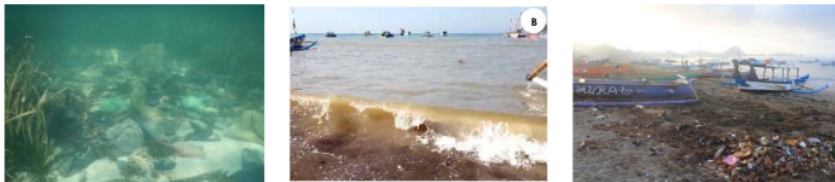
Gambar 3. Faktor penyebab kerusakan padang lamun di lokasi penelitian.