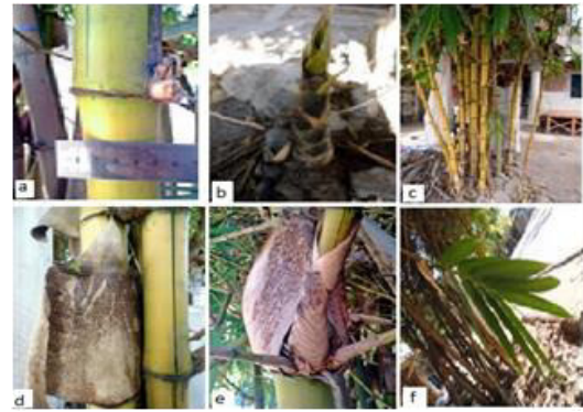
Gambar (Figure) 7. B. vulgaris var. vittata

Deskripsi: Perawakan perdu, tinggi 11-12 m, diameter 3,30-4,22 cm, 20 individu per rumpun. Akar rimpang memiliki akar udara yang tumbuh sampai buku 2-3. Ruas batang berwarna