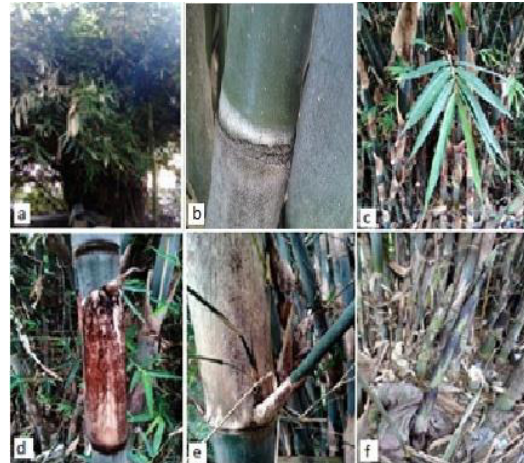
Gambar (Figure) 3. G. apus .

Deskripsi: Perawakan perdu, tinggi 8-15 m, diameter 3,15-4,10 cm, 10-63 individu per rumpun. Akar rimpang polimorf dan memiliki akar udara. Batang lurus, menyutera tersebar merata, tipis, hitam. Percabangan 1 cabang bagian tengah lebih besar dari 4-5 cabang lain, mulai muncul pada ruas