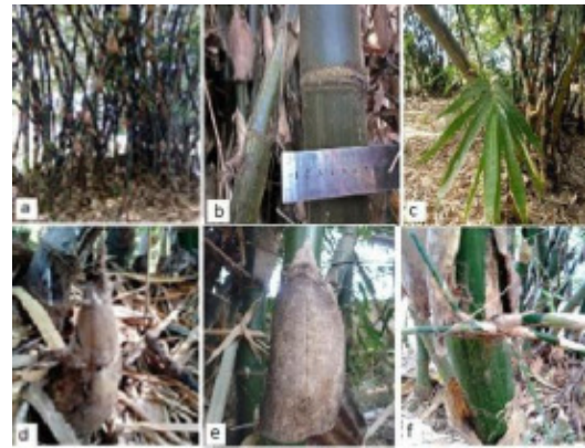
Gambar (Figure) 5. B. maculata ,

Deskripsi: Perawakan perdu, tinggi 20-23 m, diameter 4,50-6,17 cm, 86-150 individu per rumpun. Akar rimpang polimorf, akar udara muncul sampai ruas ke 2. Batang tegak, menyutera putih keabu-abuan, tersebar jarang. Percabangan hampir sama besar 3-5