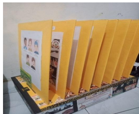
Gambar 1. Media pembelajaran Ritatoon

Setelah melewati tahap perancangan media tahap selanjutnya ialah develop yang merupakan tahap dimana mengacu pada proses validasi sebuah produk. Arikunto (2009:167) menjelaskan bahwa validitas adalah keadaan yang menunjukkan tingkat instrumen yang digunakan mampu mengukur apa yang akan diukur. Adapun validasi yang dilakukan terkait dengan validasi produk media pembelajaran Ritatoon oleh validator yang merupakan ahli pada materi dan media. Produk media yang dikembangkan adalah sebagai berikut: