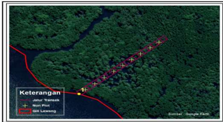
Gambar 2. Contoh letak stasiun plot pengamatan Figure 2. An example of the location of observation plot station

Berdasarkan survei lapangan, lokasi penelitian dibagi menjadi 5 stasiun. Stasiun 1, 2 dan 3 mewakili kepadatan vegetasi terdiri dari dua genus vegetasi (genus Rhizophora sp. dan Bruguiera sp.) dan stasiun 4 dan 5 diletakkan pada lokasi yang memiliki kepadatan vegetasi lebih dari dua genus vegetasi mangrove (genus Rhizophora sp., Bruguiera sp., Avicennia sp., dan Sonneratia sp.). Kusmana (2017) menyebutkan setiap stasiun pengamatan memiliki panjang 10 x 200 meter ditarik tegak lurus memotong kontur dari garis pantai menuju ke arah daratan untuk memudahkan pengambilan data di lapangan (Gambar 2). Letak geografis stasiun pengamatan disajikan pada Tabel 1.