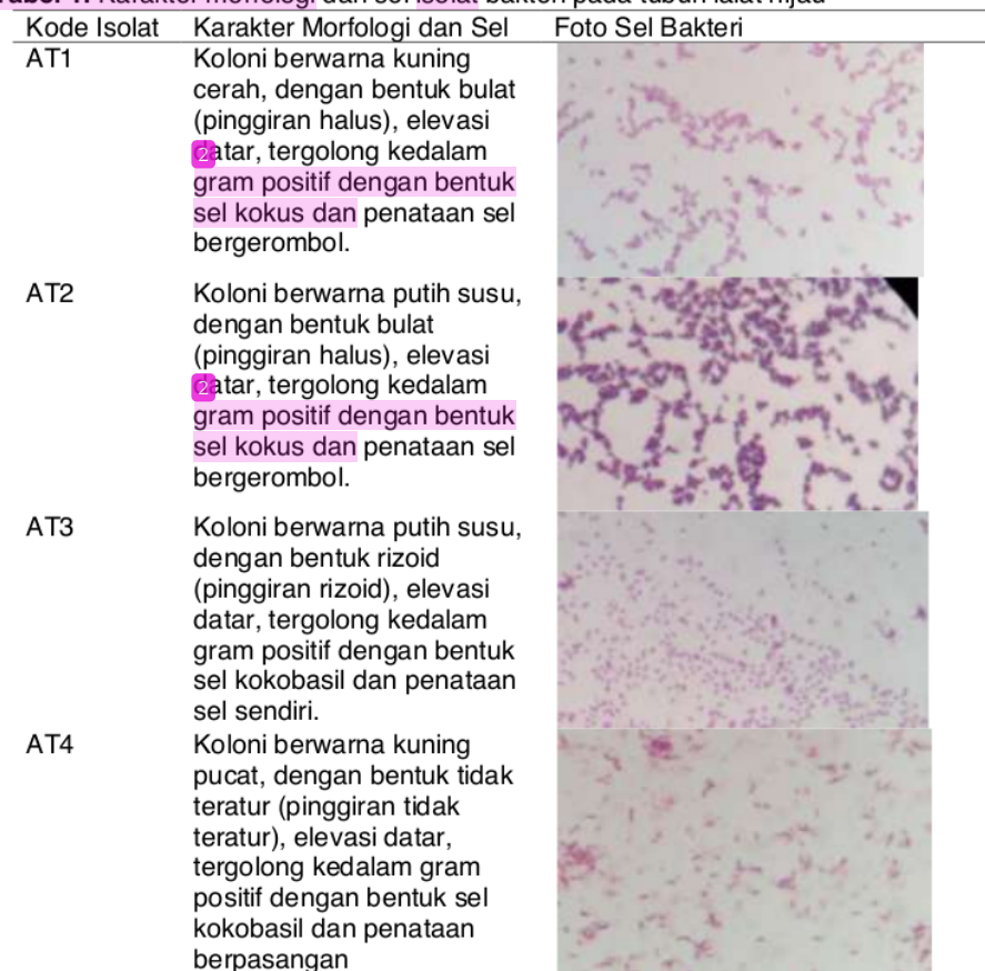
Tabel 1. Karakter morfologi dan sel isolat bakteri pada tubuh lalat hijau

Keempat isolat merupakan bakteri gram positif dan memiliki perbedaan bentuk sel, yaitu isolat AT1 memiliki bentuk sel kokus bergerombol, isolat AT2 memiliki bentuk sel kokus bergerombol, isolat AT3 memiliki bentuk sel kokobasil tunggal, dan isolat AT4 memiliki bentuk sel kokobasil berpasangan. Banyaknya jumlah isolat yang berhasil diisolasi dipengaruhi oleh jumlah sampel yang digunakan untuk penelitian. Kebutuhan nutrisi, kesesuaian media pertumbuhan serta pH media juga mempengaruhi pertumbuhan dari bakteri yang diisolasi.