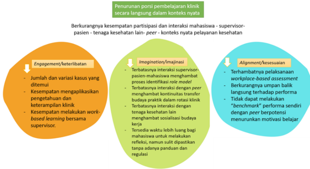
Gambar 1. Dampak Pandemi terhadap Modes of Identification dalam Lingkungan Belajar

Jika dinilai dari analisis kuantitatif, dapat dilihat bahwa persepsi lingkungan belajar baik sebelum maupun selama pandemi memiliki korelasi yang signifikan secara statistik dengan identitas profesional. Nilai r berkisar antara 0,307 hingga 0,611 pada korelasi antar subskala lingkungan belajar dengan subskala identitas profesional. Semuanya memiliki nilai p < 0,01 .