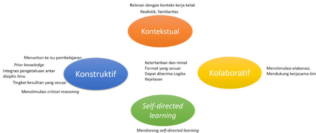
Gambar 1. Karakteristik Skenario PBL yang Baik Mendukung Keempat Prinsip PBL

Kriteria-kriteria yang disebutkan di atas mendukung keempat prinsip PBL, yaitu konstruktif, kontekstual, kolaboratif dan self-directed learning . Hal ini seperti digambarkan pada gambar.