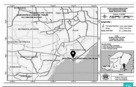
Gambar 1. Peta Lokasi Pengambilan Sampel

Variabel penelitian ini terdiri terdiri dari bobot gonad, bobot telur 10 dan jumlah telur ikan tongkol betina. Populasi dalam penelitian ini adalah seluruh 15 an tongkol yang didaratkan di PPI Tanjung Luar pada bulan Mei sampai Juni 2018. Sampel penelitian yang digunakan adalah sebanyak 120 ekor ikan tongkol betina yang diambil langsung dari nelayan. Sampel penelitian diambil selama empat kali dengan jumlah ikan tongkol yang berbeda-beda di setiap waktu pengambilan (tidak melebihi kuota yang telah ditentukan).