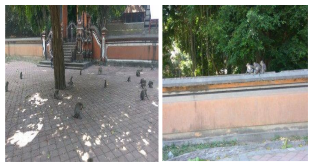
Gambar 1. Aktivitas Macaca fascicularis di Areal Wisata Gunung Pengsong 2021

Makanan Macaca fascicularis berupa tumbuhan sebanyak 33 jenis dengan bangian yang dimakan sangat tergantung dari jenis tumbuhannya. Ketersediaan makanan tersebut sangat tergantung pada musim. Sehingga tidak semua makanan tersebut tersedia setiap saat. Dengan demikian ada saatnya makanan berlimpah pada musim hujan dan kurang pada musim kering, selain itu tergantung dari kedatangan pengunjung. Tanaman yang menjadi sumber makanan mendominasi vegetasi bagian bawah gunung. Berikut makanan Macaca fascicularis di Gunung Pengsong saat dilakukan pegamatan disajikan pada Gambar 1 dan Tabel 2.