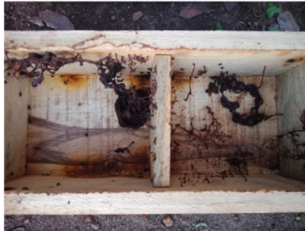
Gambar 3. Penampilan koloni lebah yang sehat (A) dan koloni lebah yang perkembangannya terganggu (B).

Selama jangka waktu penelitian dilaksanakan, tidak semua koloni dapat menghasilkan lebah yang layak untuk dipanen. Salah satu dampak yang paling jelas terasa dan