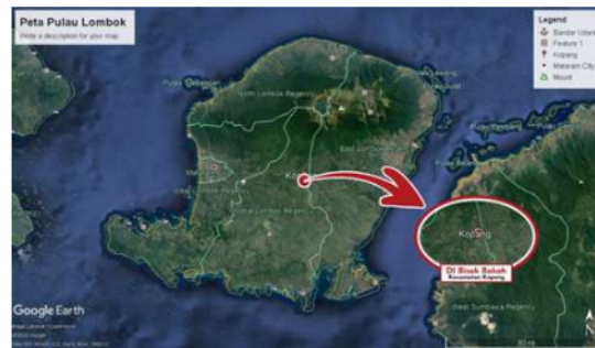
Gambar 1. Peta Lokasi Daerah Irigasi Bisok Bokah

lokasi penelitian ini berada di saluran irigasi Primer Daerah irigasi Bisok Bokah, Kecamatan Kopang, Kabupaten Lombok Tengah. Propinsi Nusa Tenggara Barat.