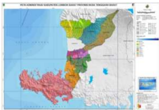
Gambar 1. Peta Administrasi Kabupaten Lombok Barat

Peta administrasi wilayah kabupaten disajikan pada Gambar 1.