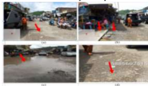
Gambar 2. Dokumentasi hasil survei visual (STA 3+400): (a) Kondisi kerusakan pada permukaan jalan, (b) Drainase dan bahu jalan lebih tinggi dari permukaan jalan, (c) Genangan air dipermukaan jalan setelah banjir/hujan, (d) Lapisan permukaan terkelupas.

Hasil survei visual di lokasi penelitian ditemukan banyak ketidaksesuaian secara teknis yang berdampak pada kerusakan jalan. Hal tersebut antara lain: drainase yang posisinya tertutup dan lebih tinggi dari permukaan aspal, terdapat tumpukan material di bahu jalan sehingga elevasi bahu jalan lebih tinggi dari permukaan aspal, genangan air, dan banjir saat hujan. Beberapa hasil survei lapangan yang didokumentasikan ditunjukkan pada Gambar 2.