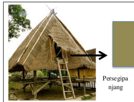
Gambar 5. Pintu Rumah

Pintu Uma Lengge terletak dilantai dua dengan bentuk geometri persegipanjang. Pintu rumah dibuka dengan menarik ke atas daun pintunya. Jika ingin membuka pintu dalam waktu yang lama, biasanya masyarakat sudah menyiapkan kayu penyanggahnya sehingga pintu tidak tertutup. Perhatikan gambar 5 berikut ini.