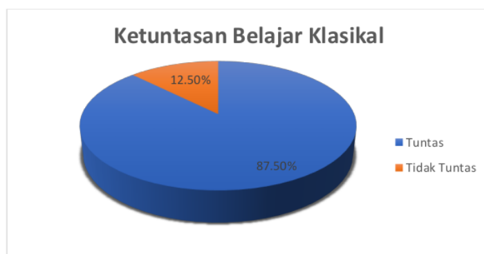
Gambar 1. Ketuntasan Belajar Klasikal

Berdasarkan hasil di atas dapat diketahui bahwa sebanyak 14 siswa yang tuntas belajarnya atau sebesar 87,50% (ketuntasan belajar klasikal) dengan nilai tertinggi yang diperoleh siswa yaitu 97. Dan terdapat 2 siswa yang nilainya tidak memenuhi KKM atau sebesar 12,50% (ketuntasan belajar klasikal) dengan nilai yang diperoleh yaitu 66. Rata-rata nilai yang diperoleh kelas VIII-1A sebesar 82,38. Berdasarkan tabel 6 dapat digambarkan melalui diagram sebagai berikut.