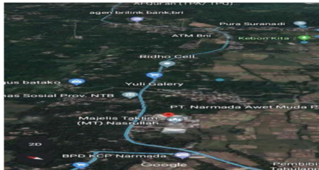
Gambar 2. Lokasi Penelitian

Studi analisis kajian ini dilakukan di jaringan Jalan Selat-Suranadi yang terletak di Kecamatan Narmada Kabupaten Lombok Barat Provinsi Nusa Tenggara Barat.