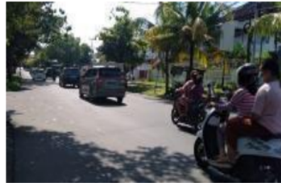
Gambar 2. Jalan Brawijaya