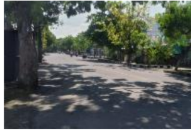
Gambar 1. Jalan Adi Sucipto