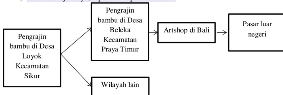
Gambar 1. Saluran Pemasaran Tidak Langsung

Dalam melakukan suatu pemasaran, pengusaha harus menentukan sistem pemasaran yang akan dilakukan terlebih dahulu. Berdasarkan penelitian yang telah dilakukan, pengusaha kerajinan anyaman bambu di Desa Loyok menggunakan sistem pemasaran tidak langsung. Dimana sistem pemasaran tidak langsung ini merupakan sistem pemasaran yang menggunakan saluran pemasaran atau media pemasaran dalam memasarkan produknya (Fahrurrozi & Mispandi, 2021). Untuk lebih jelasnya, dapat dilihat pada Gambar 1.