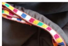
Motif: Teken bajo

akan diisi satu-persatu dengan benang warna warni dengan cara di bordir menggunakan mesin jahit. Bagian ini merupakan bagian paling sulit karena memerlukan ketelitian agar motif sesuai yang diharapkan (wawancara dengan inaq Sucihera pada 2 Agustus 2021). Adapun motif khas dari desa Sukarara adalah motif teken bajo dan ulat tipah (Gambar 2).