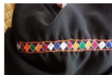
Motif: Ulat tipah