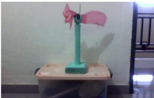
Gambar 4 : Alat Peraga Pembangkit Listrik

(d) alat peraga pembangkit listrik sederhana tenaga angin. Alat ini terbuat dari kayu dan plastik serta dinamo kecil sebagai pembangkit listriknya. Alat ini mampu memberikan contoh nyata kepada peserta didik tentang bagaimana listrik dihasilkan dan di alirkan ke rumah-rumah,