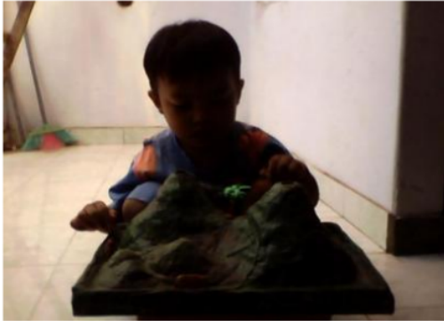
Gambar 1 : Alat Peraga Gunungapi

dan keluarnya magma. Proses ini terjadi dari reaksi pencampuran soda kue, asam sitrat dan air yang sudah diberi pewarna merah. Reaksi pencampuran ini akan menghasilkan ledakan kecil yang dibarengi dengan meluapnya cairan hasil reaksi keluar miniatur gunungapi. Hal ini akan memberikan pengalaman nyata kepada peserta didik tentang proses ledakan dan keluarnya magma pada aktifitas gunungapi yang sebenarnya.