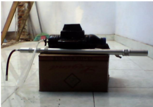
Gambar 2 : Alat Peraga Kapal Selam Sederhana

2 (b) alat peraga kapal selam sederhana. Kapal selam sederhana ini terbuat dari berbagai jenis botol plastik yang disatukan dengan lem sehingga berbentuk kapal selam. Bagian dalam dari kapal selam ini diberi balon untuk zat pengapung. Alat ini mampu memperlihatkan kepada peserta didik bagaimana sebuah kapal selam bisa mengapung, melayang dan tenggelam di air. Hal ini akan memberikan contoh nyata kepada peserta didik sehingga konsep terapung, tenggelam dan melayang dapat dipahami dengan baik,