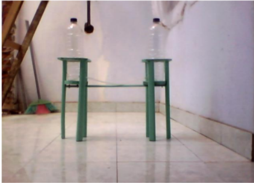
Gambar 3 : Alat Peraga Aliran Air

(d) alat peraga pembangkit listrik sederhana tenaga angin. Alat ini terbuat dari kayu dan plastik serta dinamo kecil sebagai pembangkit listriknya. Alat ini mampu memberikan contoh nyata kepada peserta didik tentang bagaimana listrik dihasilkan dan di alirkan ke rumah-rumah,