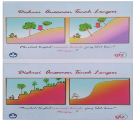
Gambar 2a. Diskusi 1 ancaman tanah longsor