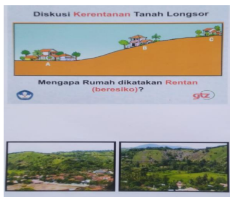
Gambar 2d. Diskusi 4 ancaman tanah longsor

Tanggapan dan pendapat guru mengenai pembelajaran mitigasi bencana di SD Negeri 1 Sembalun adalah: (1) Tanggapan dan pendapat guru mengenai materi model pembelajaran mitigasi bencana (MPMB) dan struktur pembelajaran mitigasi bencana (SPMB) dan alokasi waktu yang tersedia untuk setiap kegiatan pembelajaran mitigasi bencana.