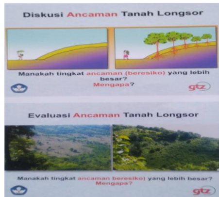
Gambar 2c. Diskusi 3 ancaman tanah longsor