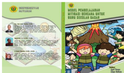
Gambar 4. Cover buku model pembelajaran mitigasi bencana untuk guru sekolah dasar

untuk guru sekolah dasar. Seperti pada gambar 3 berikut ini: