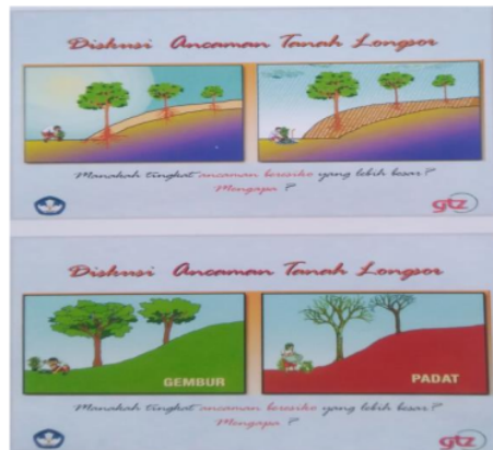
Gambar 2b. Diskusi 2 ancaman tanah longsor