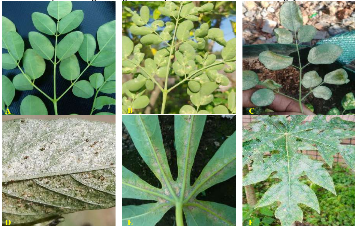
Gambar 1. Gejala serangan tungau hama pada tanaman kelor dan inangnya

Keterangan : (A) Daun kelor sehat. (B) Gejala serangan sedang. (C) Gejala serangan tinggi. (D) Gejala serangan pada bayam. (E) Gejala serangan pada ubi kayu. (F) Gejala serangan pada pepaya