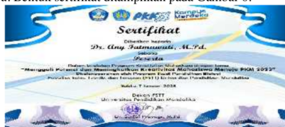
Gambar 6. Contoh Sertifikat Peserta Workshop PKM 2023

Kegiatan workshop PKM dikontrol dengan daftar hadir peserta kegiatan dengan dua cara yaitu, bagi peserta yang mengikuti melalui zoom secara mandiri mengisi absensi melalui link https://forms.gle/ePo37VAhRjYSsgGt6 . Sedangkan bagi peserta yang mengikuti zoom melalui aula mengisi absensi secara manual. Setelah selesai kegiatan presentasi dan diskusi, maka kegiatan selanjutnya adalah pembentukan kelompok PKM mahasiswa. Sampai acara selesai telah terbentuk 16 kelompok PKM mahasiswa dengan variasi anggota kelompok heterogen dari berbagai program studi yang ada di Fakultas Sains, Teknik dan Terapan UNDIKMA. Selanjutnya peserta yang mengikuti kegiatan diberikan sertifikat sebagai salah satu penghargaannya. Bentuk sertifikat ditampilkan pada Gambar 6.