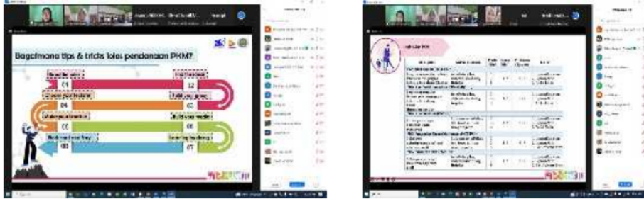
Gambar 2 Kegiatan Pemaparan Materi Melalui Zoom