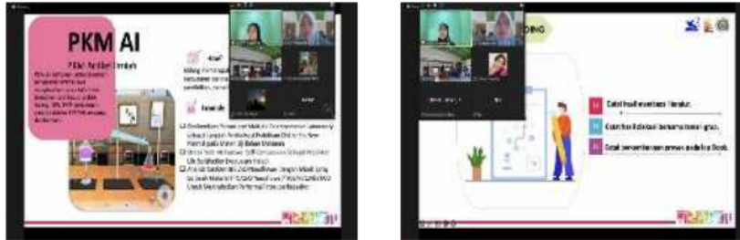
Gambar 3. Kegiatan Presentasi oleh Pemateri

Kegiatan PKM tentu membutuhkan kerja keras dan komitmen yang kuat dari mahasiswa yang harus diiringi dengan kerja sungguh-sungguh dan disertai doa. Selain itu bimbingan dan arahan dosen pendidikan Biologi juga sangat diperlukan agar tercapai tujuan dapat menggali potensi mahasiswa dalam PKM. Oleh sebab itu dibutuhkan kerjasama antar mahasiswa dan dosen secara berkelanjutan.