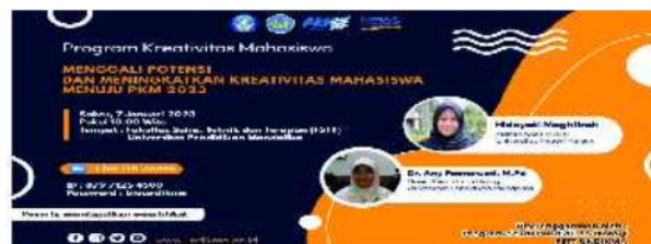
Gambar 1. Flayer Kegiatan Workshop Program Kreativitas Mahasiswa

Sebelum kegiatan dimulai panitia telah membuat Flayer (Gambar 1) sebagai media untuk menyebarkan informasi kegiatan workshop ke berbagai pihak. Flayer ini disebarkan ke mahasiswa Pendidikan Biologi Undikma dan mahasiswa lainnya melalui media sosial diantaranya, grup WA, facebook , dan Instagram . Kegiatan penyebarluasan informasi melalui media online efektif dalam lebih cepat diterima oleh sasaran yang dituju (Dharma & Sudewiputri, 2021). Secara keseluruhan peserta yang mengikuti kegiatan adalah dari mahasiswa sejumlah 100 orang, dosen sejumlah 20 orang, dan umum sejumlah 2 orang. Kegiatan workshop berjalan selama 120 menit yang dilakukan mulai pukul 09.00–11.00 WITA.