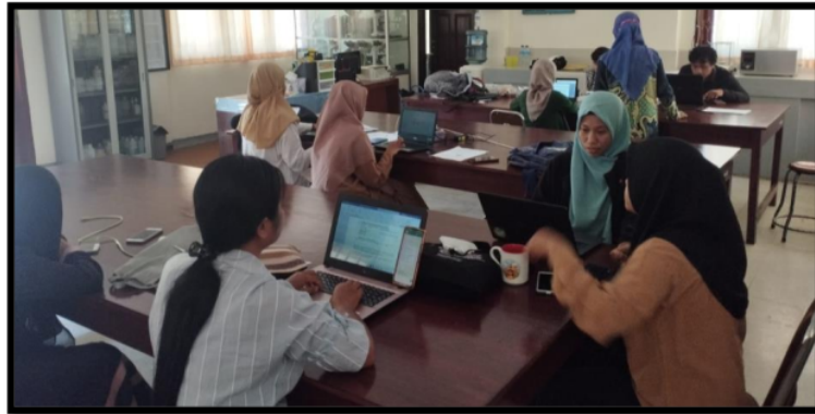
Gambar 4. Pendampingan pada Tahap Submitting Proposal PKM.