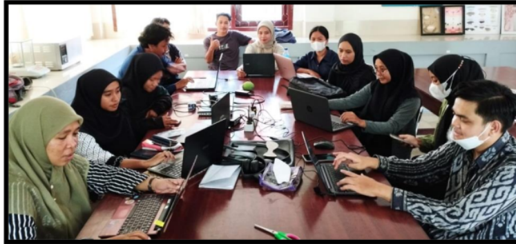
Gambar 2. Proses Pendampingan Penyusunan Proposal oleh Alumni dan Dosen Program Studi Pendidikan Biologi Sekaligus Memeriksa Bagian-bagian Proposal yang Masih Perlu Direvisi.

sampai sejauh ini terlihat bersemangat setiap harinya untuk menyelesaikan proposal yang akan mereka usulkan. Lebih jelasnya mengenai kegiatan pada tahap ini dapat dilihat pada Gambar 2.